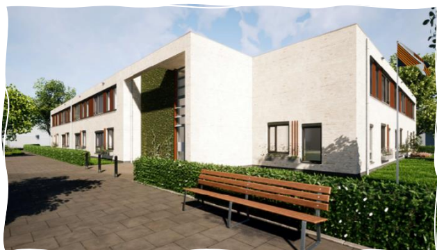
Afbeelding: Artist impression Futurahuis Ter Aar

Het nieuwe Futurahuis, gelegen aan de Aalscholverlaan in Ter Aar, is gelegen in een rustige, bestaande woonwijk. Het gebied kenmerkt zich door haar prachtige landelijke ligging. Het Futurahuis biedt plaats aan 17 alleenstaande ouderen en 3 ouderenechtparen.